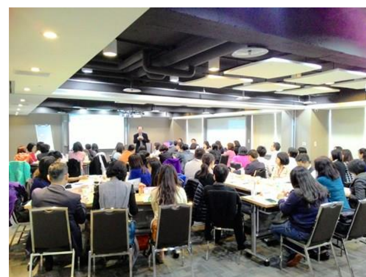
(來賓專注聆聽蘭老師的精彩分享-1)