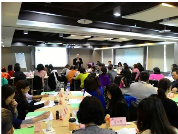
(來賓專注聆聽蘭老師的精彩分享-2)