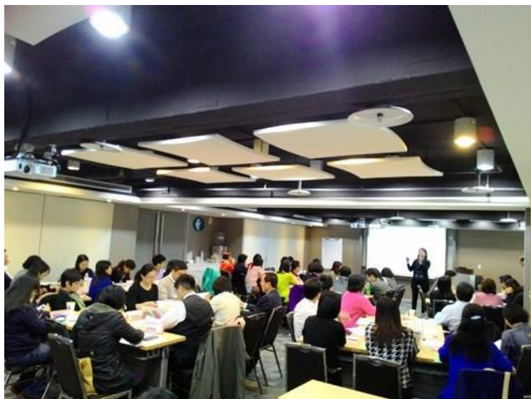
(蘇麗美顧問簡介104HR主管智策會)