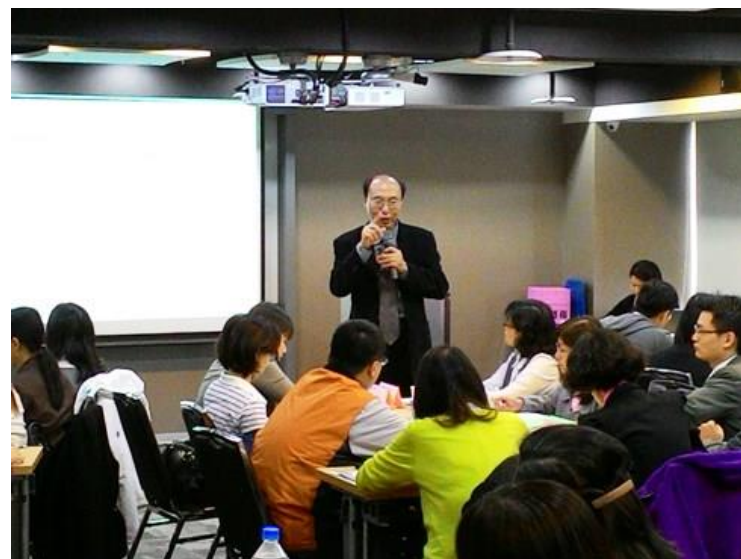
(蘭琦生老師主講：菁英人才遴選方法與工具運用)