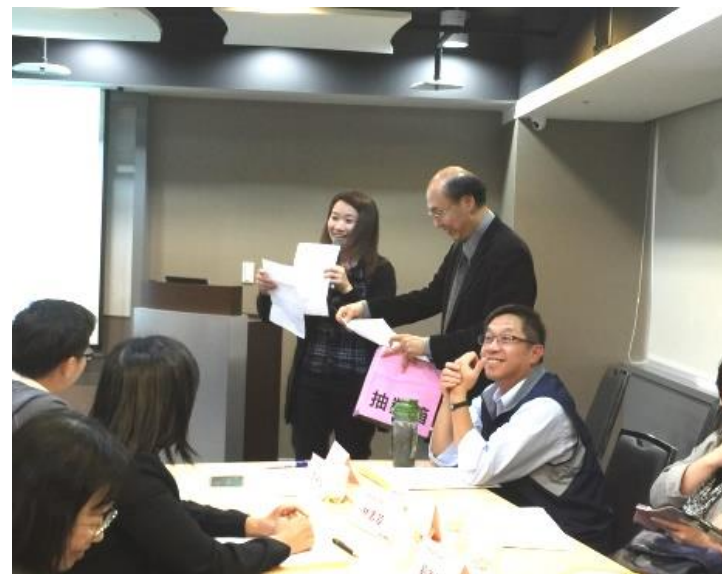
(蘭老師協助進行活動抽獎)